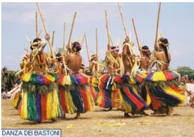
DANZA DEI BASTONI