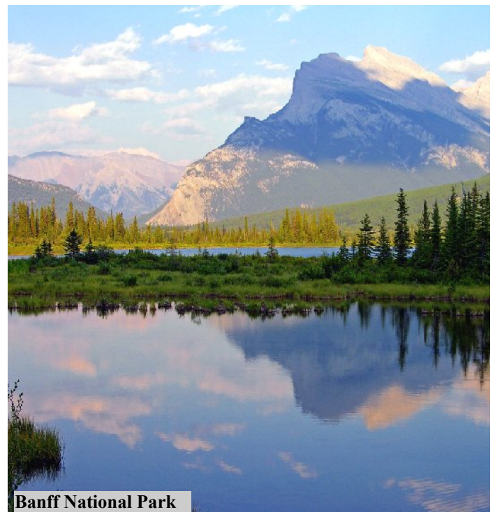
Banff National Park

La quotazione dipende dal numero di partecipanti e dalla categoria dell'autovettura prescelta. Chiedeteci un preventivo.