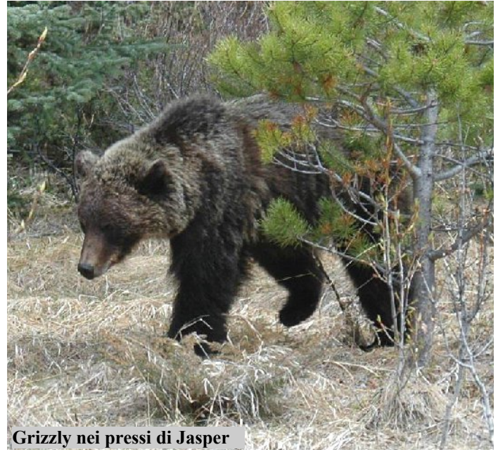
Grizzly nei pressi di Jasper

Visita della zona del lago di Okanagan, che, secondo antiche leggende, avvalorate da numerosi avvistamenti, sarebbe abitato da un misterioso serpente marino, lungo oltre 13 metri. E' questa una regione prevalentemente agricola, che gode di un tempo stupendo e vanta numerose fiere e festival che vengono organizzate durante la primavera. In estate vengono organizzate gare di ballo e competizioni di Triathlon. In serata rientro a Vancouver e restituzione dell'auto.