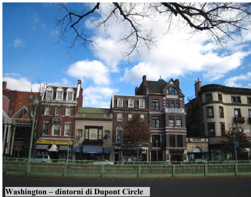
Washington – dintorni di Dupont Circle