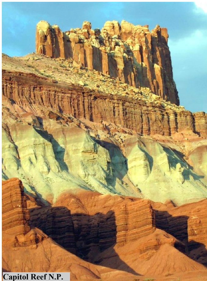
Capitol Reef N.P.

riconsegna dell'automobile presso la stazione dell'aeroporto e partenza per la vostra destinazione successiva o per chi lo desidera prolungamento (su richiesta) del soggiorno a Los Angeles e/o dintorni.