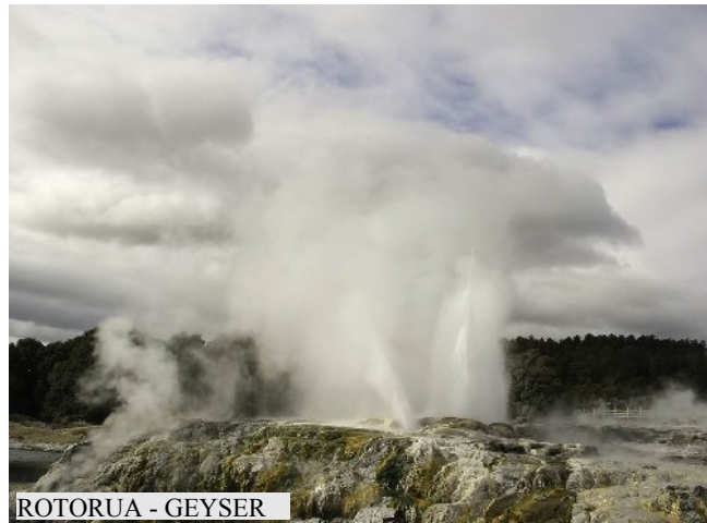
ROTORUA - GEYSER

Prima colazione. Trasferimento all'aeroporto e imbarco per la destinazione successiva.