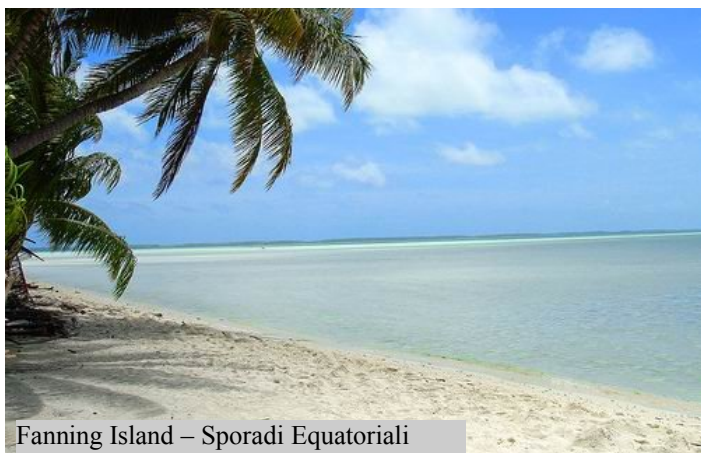
Fanning Island – Sporadi Equatoriali