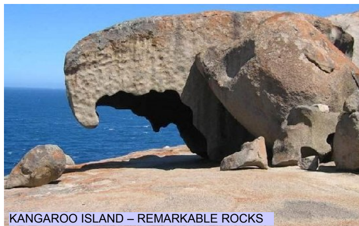
KANGAROO ISLAND – REMARKABLE ROCKS

Questa mattina farete un tour di mezza giornata alla Sydney Tower, al Sydney Wildlife World e al Sydney Aquarium. Tempo a disposizione per pranzo libero. Al pomeriggio rientro in hotel. Sistemazione: Hotel Four Points by Sheraton.