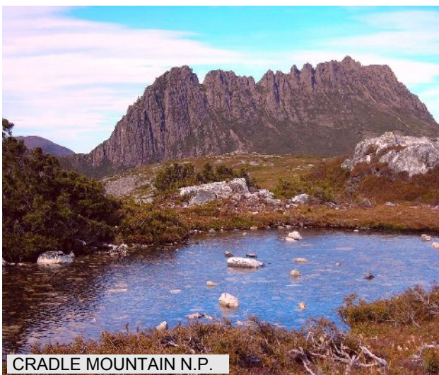
CRADLE MOUNTAIN N.P.