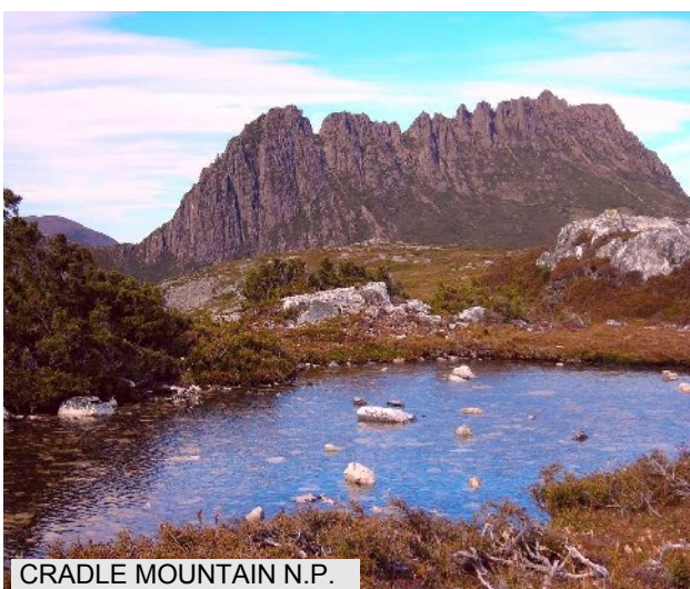
CRADLE MOUNTAIN N.P.