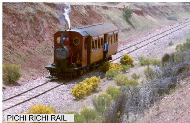
PICHI RICHI RAIL