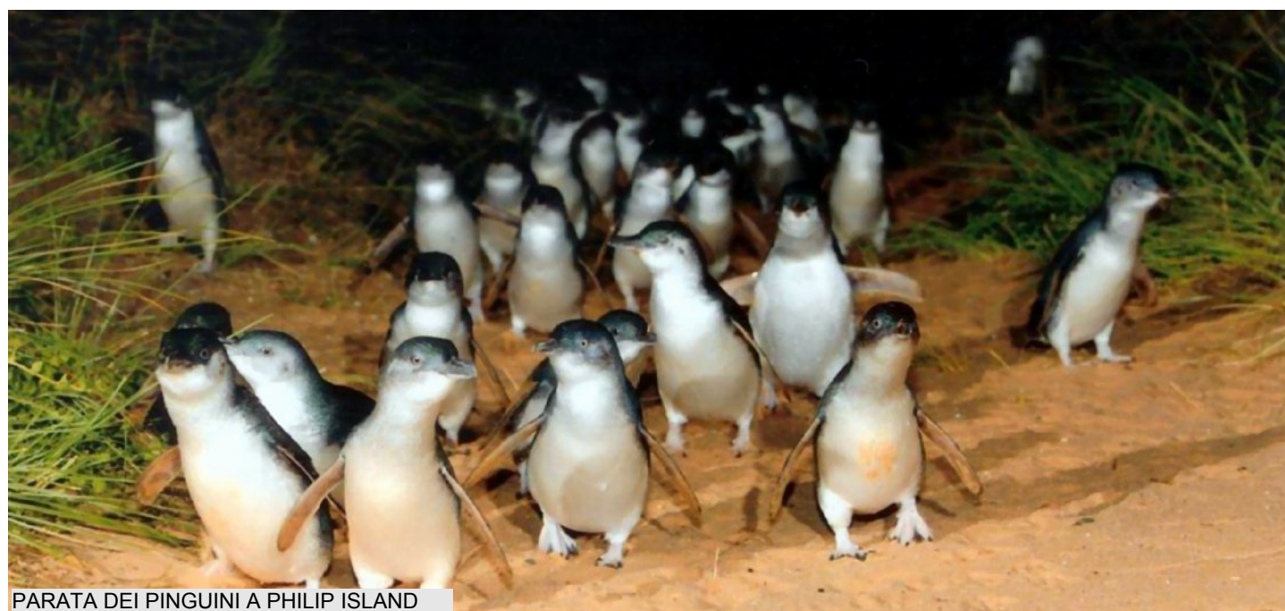
PARATA DEI PINGUINI A PHILIP ISLAND