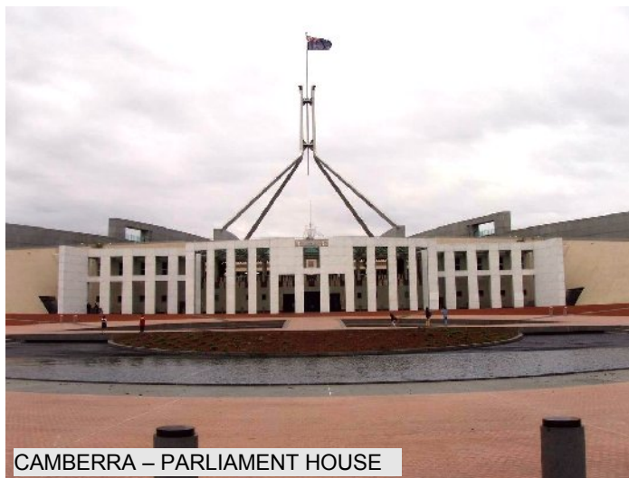
CAMBERRA – PARLIAMENT HOUSE

poiché le tariffe aeree variano a seconda del vettore e della stagionalità, con periodi di promozioni e tariffe speciali, preferiamo per maggiore esattezza e trasparenza comunicarvele all'atto della richiesta del preventivo.